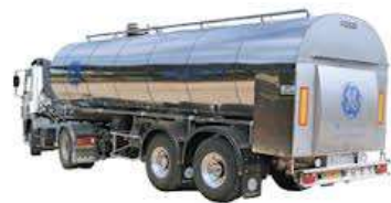
Citerne inox ou alu