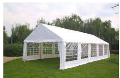
Bâches de chapiteau