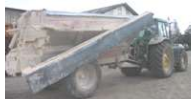
Epandeurs à chaux