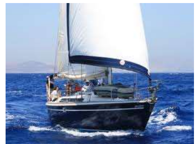
Voiles et coques